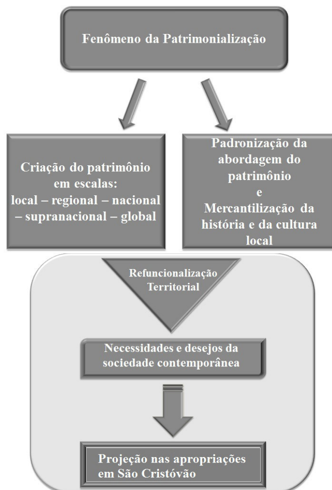
Figura 2. Modelo de análise – fenômeno da patrimonialização.

Fonte: Elaboração própria a partir de Quivy e Campenhoudt (2005).